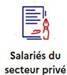
Salariés du secteur privé

Deuxièmement, le parcours France VAE est accessible à toutes les personnes ayant l'un des statuts suivants :